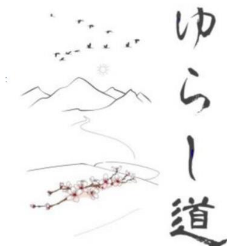
(Grafik: Misao Morota & Esther Spieß, Copyright 2025)

YURASHI DO ..... der Weg, der auch das Ziel ist